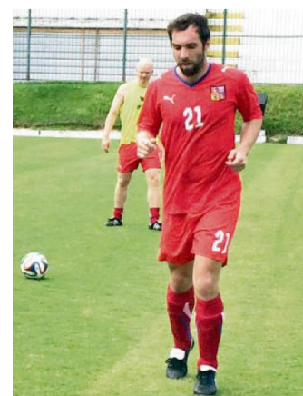
V reprezentačním dresu.

Pravidla turnaje jsou striktní, všichni fotbalisté se musejí prokázat lékařským diplomem. Navíc, pokud ně-